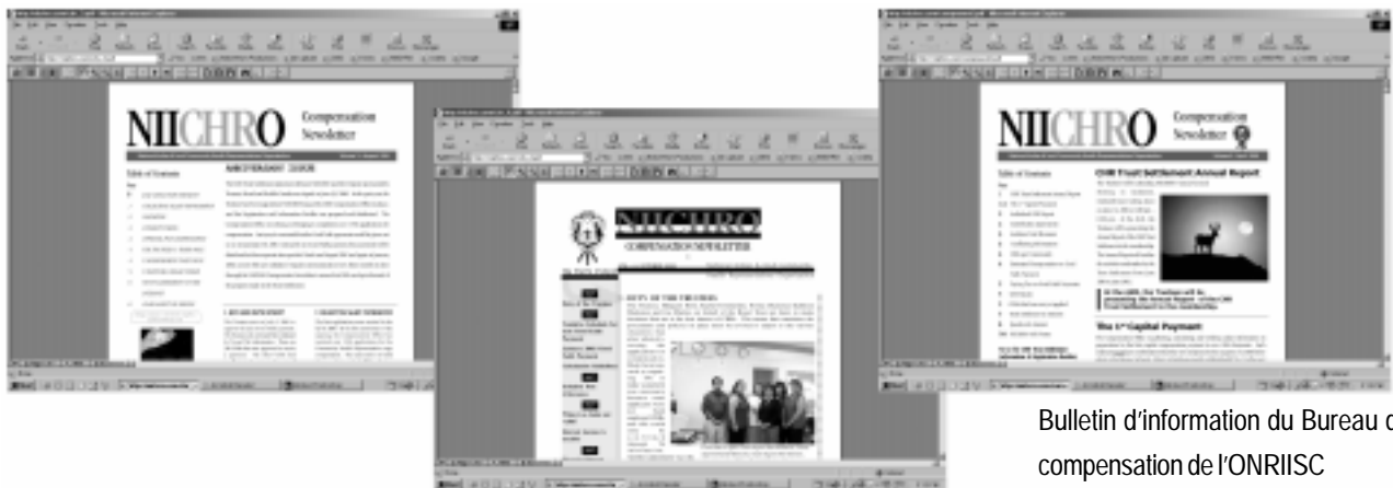
Bulletin d'information du Bureau de compensation de l'ONRIISC

Les visiteurs du site Web de l'ONRIISC ( www.niichro.com ) peuvent consulter les volumes 1 à 8 du bulletin d'information du Bureau de compensation de l'ONRIISC en cliquant sur l'option Bureau de compensation des RSC. Seuls les bénéficiaires admissibles ont accès à l'Entente de règlement. Pour ce faire, ils doivent communiquer avec un agent de demande afin d'obtenir leur nom d'utilisateur et un mot de passe.