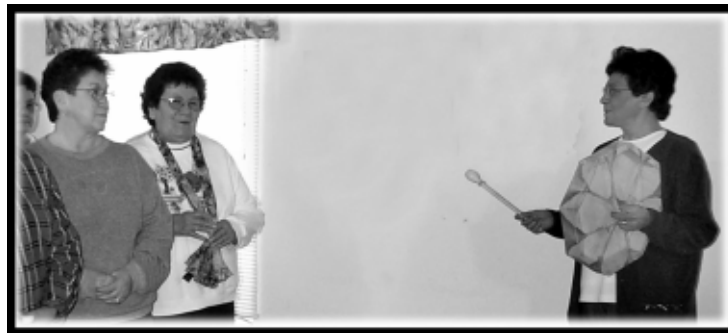
Un groupe d'ainés chante à Listiguj

Tel que prévu par l'Entente de règlement en faveur des RSC, aucun chèque ne sera remis à un RSC à moins qu'il ne signe les formules de décharge. La lettre qui suit et les deux (2) formules de décharge sont des spécimens de ceux envoyés aux RSC dont les demandes ont été approuvées en vue d'un paiement de bonne foi. La déclaration de revenus du fonds en fiducie a été produite, et les bénéficiaires de paiements de bonne foi ont reçu un relevé T3 pour usage fiscal. Seuls les RSC qui ont présenté les formules de décharge et qui ont bénéficié d'un paiement ont reçu ce relevé.