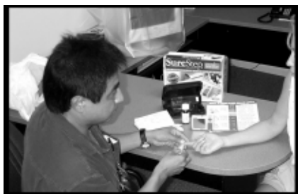
RSC démontrant comment mesurer la glycémie

L'Agence des douanes et du revenu du Canada est le ministère pour lequel le délai d'attente est le plus long. Ce ministère est en mesure de fournir les meilleures pièces justificatives qui soient en matière d'informations salariales, mais il faudra pour cela plus de temps que prévu.